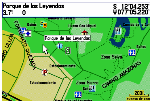
Detalle en C.Comerciales, Parques y Zonas de Trekking (Garmin gpsmap 276c)