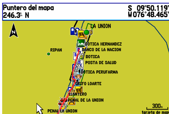
Vista de La Union, ruta Conococha - Huanuco