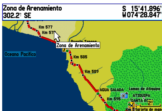
Información del Terreno (En un Garmin gpsmap 276c)

12. Se ha incluido áreas de información del terreno (pantanos, zonas derrumbe, de arenamiento, de declives pronunciados, etc.)